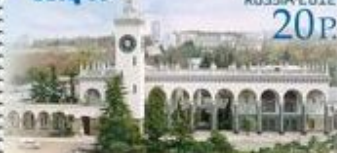
Сочи. Железнодорожный вокзал

Дендрарий — памятник садово-паркового искусства, основанный С.Н. Худековым в 1892 году. Уникальная коллекция парка непрерывного цветения насчитывает свыше 1700 видов и разновидностей растений со всех континентов.