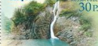
Сочи. Ореховский водопад