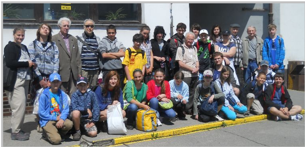
Účastníci filatelistickej olympiády 2012