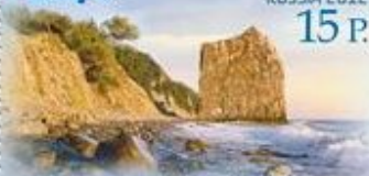
Геленджик. Скала Парус

Скала Парус, расположенная в 17 км от Геленджика, стоит перпендикулярно берегу моря, на три четверти в воде. Природный памятник высотой 30 м и толщиной около метра по форме напоминает четырёхугольный парус.