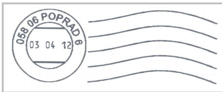
Odtlačok nového typu pečiatkovacieho stroja Pitney-Bowes z Pošty 6